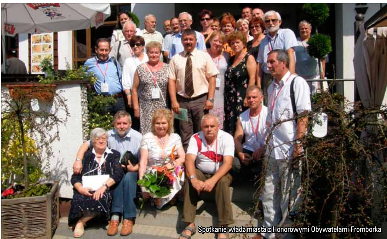
Spotkanie władz miasta z Honorowymi Obywatelami Fromborka