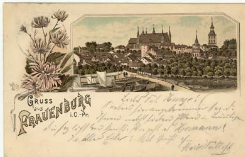
Karta pocztowa z 1897 roku z panoramą Fromborka od północy. Pierwsza znana pocztówka z Fromborka wykonana w technice litografii barwnej. Wysłana 03.09.97 z Fromborka i 04.09.07 była dostarczona do Leipzig